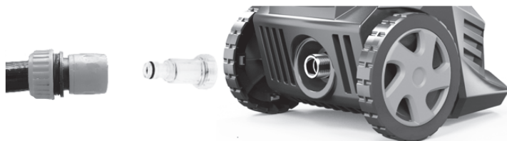
Рисунок 3. Схема встановлення вхідного водяного фільтра та вхідного рукава.

3. Приєднати вхідний рукав до сітчастого фільтра тонкого очищення нарізного типу або фільтра із конектором (рис. 3).