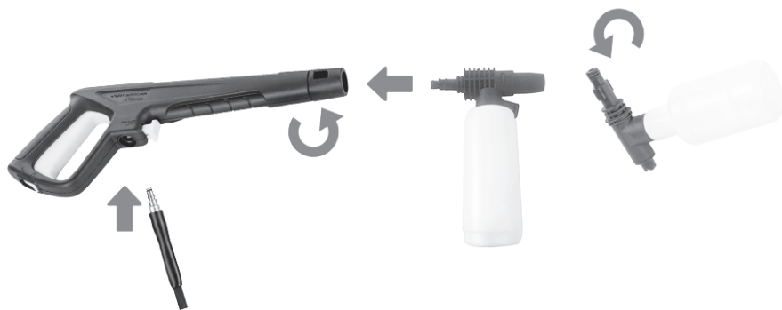
Рисунок 5. Схема встановлення пінної насадки.