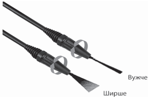
Рисунок 4. Схема регулювання форми вихідного струменю універсальною форсункою.

Регульована форсунка («Вужче»/«Ширше») дає змогу отримати струмінь необхідної форми та з різним напором і впливу на поверхні, які очищуються. Чим більша площа розпилення, тим менше енергія струменю. Регулювання форми вихідного струменя здійснюється рухом універсальної форсунки водяного пістолета (рис. 4): обертання корпусу форсунки «ліво/право» змінює форму струменю та на напір струменю.