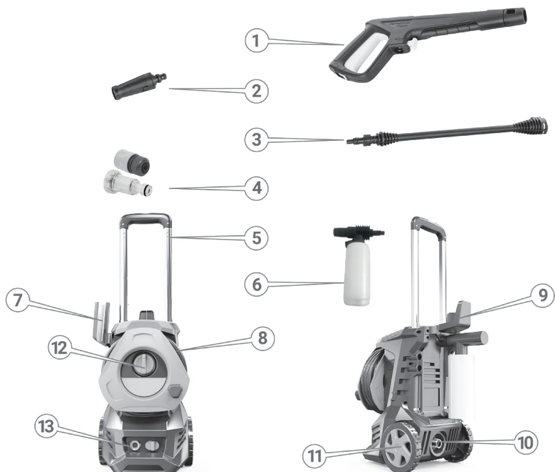
Рисунок 1. Загальний вигляд виробу та комплектування.