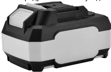
Рисунок 2. Загальний вигляд акумуляторної батареї.