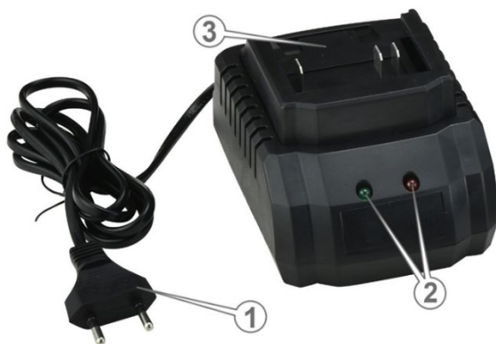
Рисунок 3. Загальний вигляд зарядного пристрою.

Для перших заряджвань акумуляторної батареї потрібно більше часу. Час заряджання батареї може змінюватися залежно від температури довкілля.